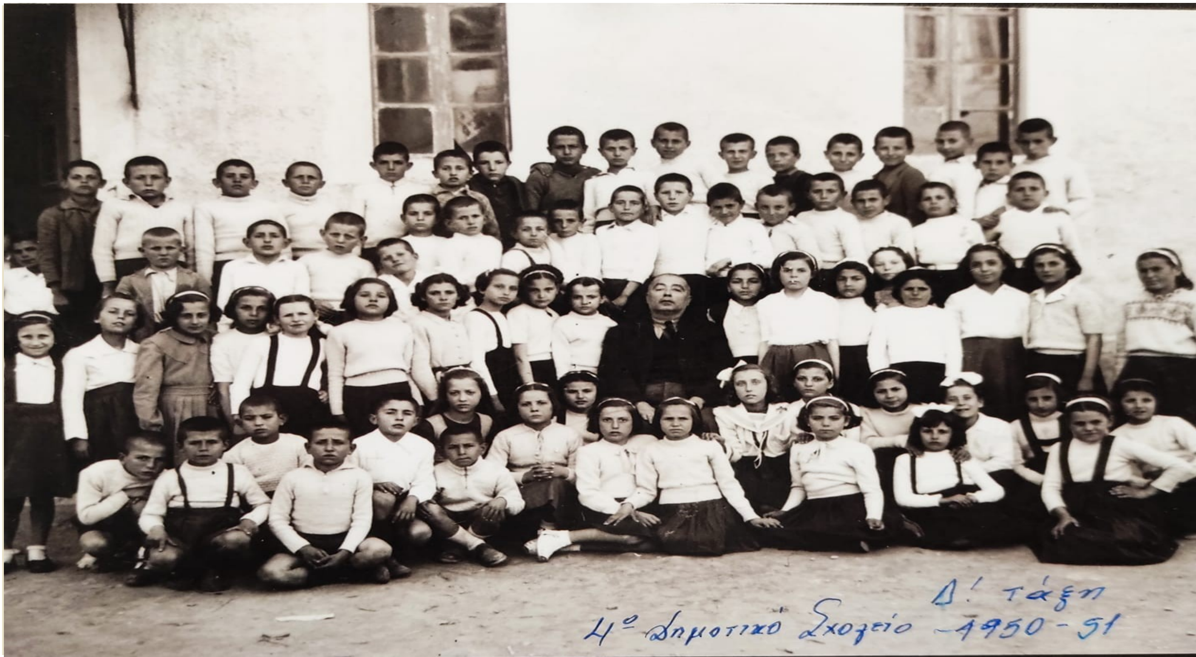
Δ' τάξη 4 ο Δημοτικό Σχολείο - 1950-51