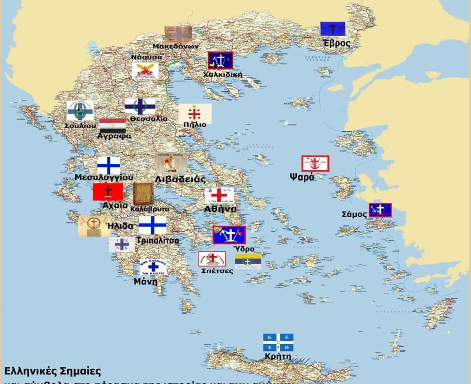
Ελληνικές Σημαίες και σύμβολα στο πέρασμα της ιστορίας και των αγώνων. Επανάσταση 1821