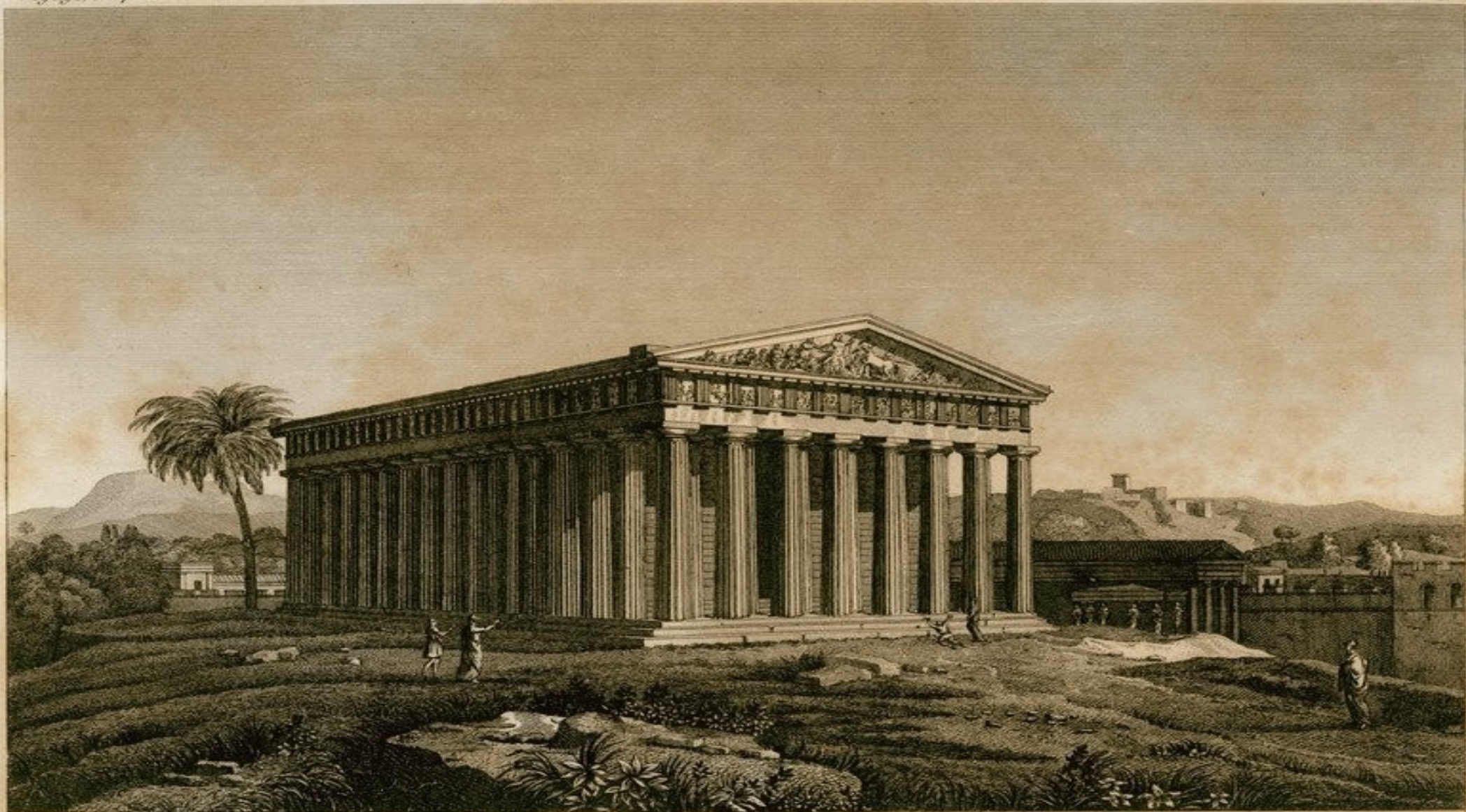
Vue perspective du Parthénon.