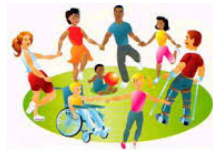
Εικόνα 1. Ο κύκλος ανοίγει και το παιδί παίρνει τη θέση του δάδου στα μέλη όρι στο κέντρο.